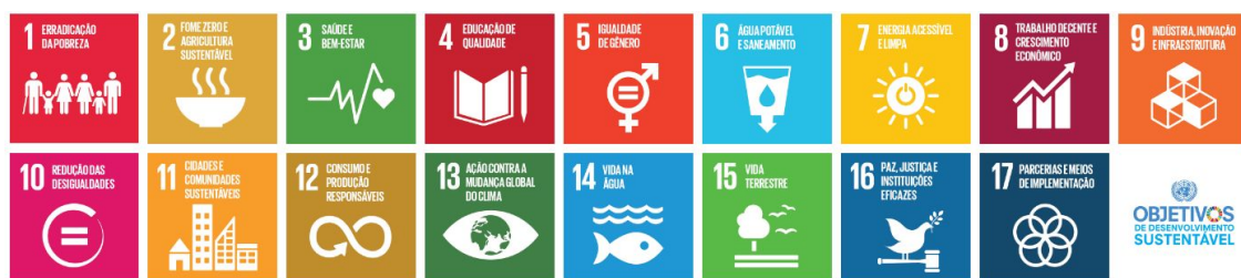
Figura 1 - Objetivos de Desenvolvimento Sustentável.

Assim, em agosto de 2014, o GTA-ODS finalizou e submeteu a proposta dos 17 Objetivos de Desenvolvimento Sustentável, e das 169 metas associadas à apreciação da Assembleia Geral da ONU em 2015. A proposta ainda discute sobre a fiscalização dos mesmos, com mais de 300 indicadores propostos para o seu seguimento e ressalta que os objetivos e as metas deverão ser monitorados e revisados por um conjunto de indicadores globais, além de indicadores regionais e nacionais (ALVES, 2015).