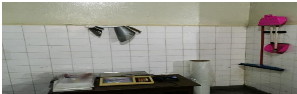
FIGURA 8 - Estação de Limpeza.

cronogramas não eram seguidos. Identificamos que a causa raiz do problema era má formulação do manual, contendo regras desnecessárias e inflexíveis em situações de flutuação da demanda. O plano de ação foi ineficaz, portanto, descartado.