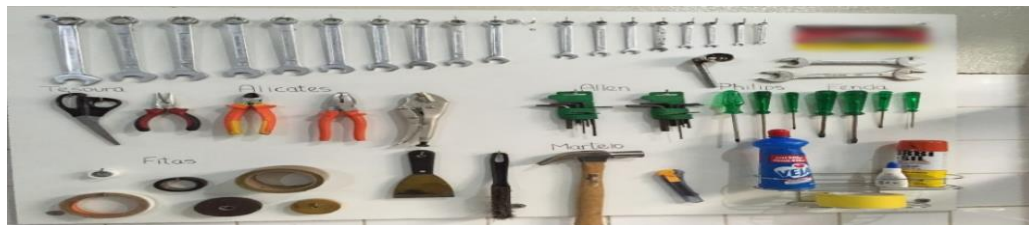
FIGURA 5 – Quadro de ferramentas.

A Figura 6 lista algumas das ações tomadas durante as auditorias que obtiveram resultados satisfatórios.